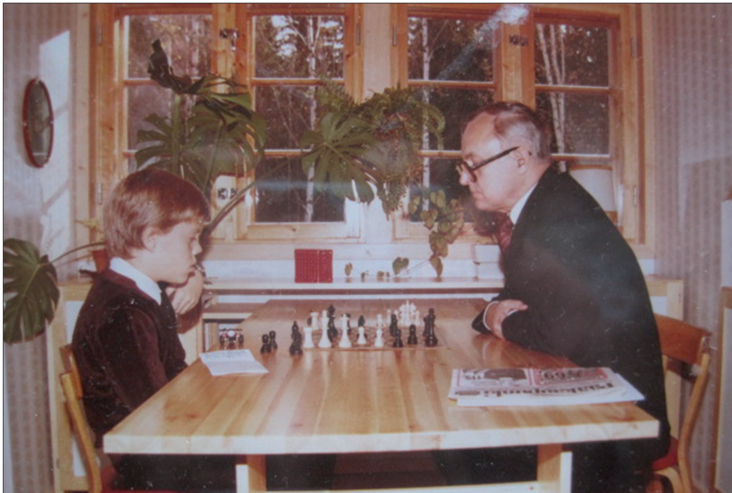
Vaari opetti Aleksille shakkia. Pappa opetti kalastamaan.