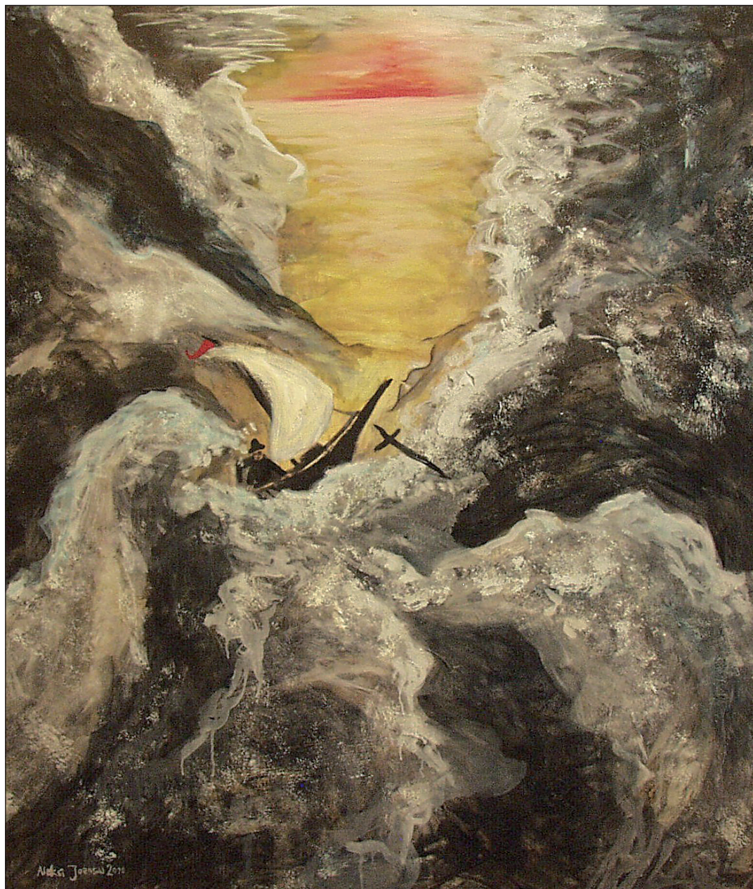
Vanerille maalattu myrsky on pleksin alla ulkona säilynyt 10 vuotta.