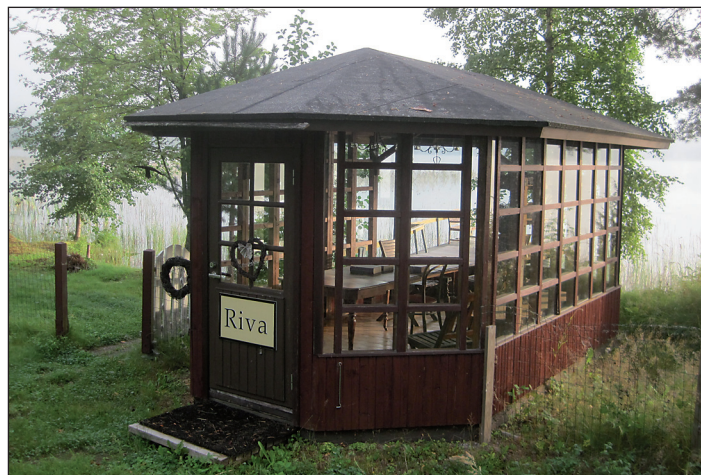
Rivassa kirjoja, kehystettyjä pikkukuvia, vaikka lahjaksi.