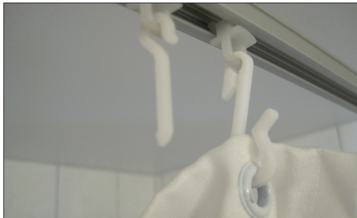
Kuka korjaa tämänkin?