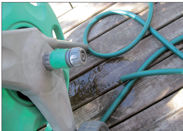
Ei pysy letku liittimessä.