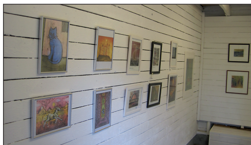
Mezzo. Talvella klapeja, kesällä kuvia. 13 metriä seinää.