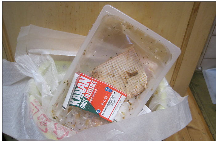
Roskapussi ylitäynnä tyhjä.

Muovin kierrätys on mut- kikasta. Kun on vaikea tietää mikä muovilaatu sopii kierrätykseen, sekajätteeseen menee kaikki. Hyvästit kier- rätyksen jalolle aatteelle.