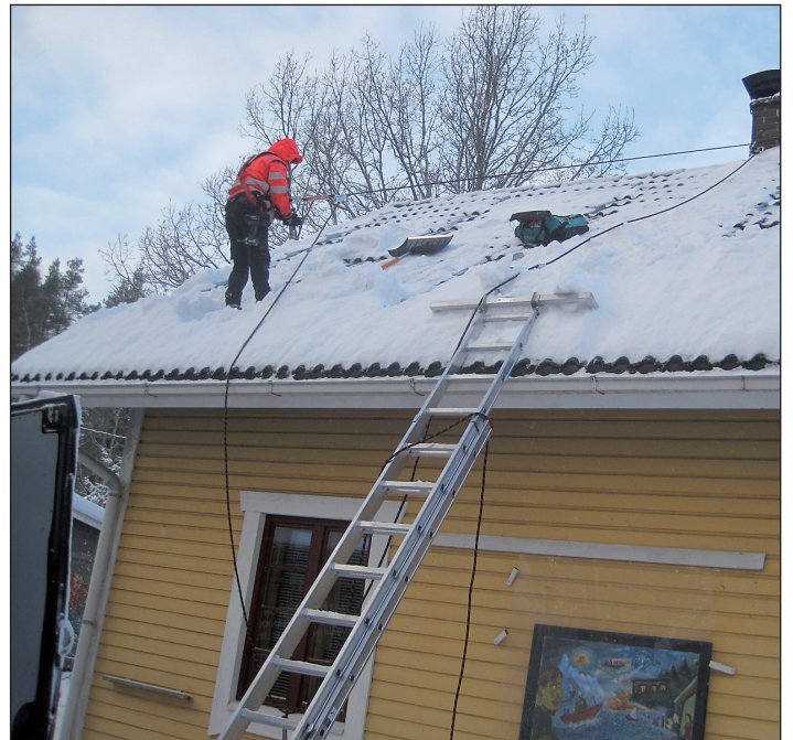
Kolme miestä tuli töihin.