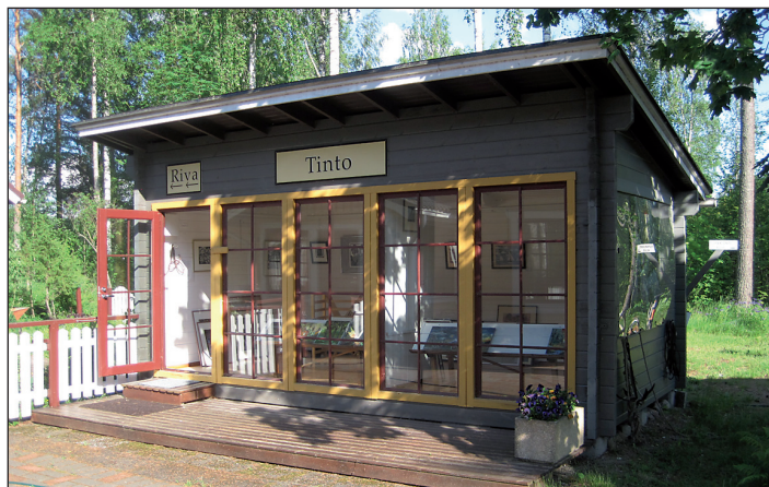
Tinto ja Aqua ovat samanlaiset. Molemmissa 12,4 metriä seinätalaa kuville.

Googleta Synaptori, avaa arkisto. Lue ilmaiseksi ja sitoutumatta, ilman salasanoja ja käyttäjätunnuksia.