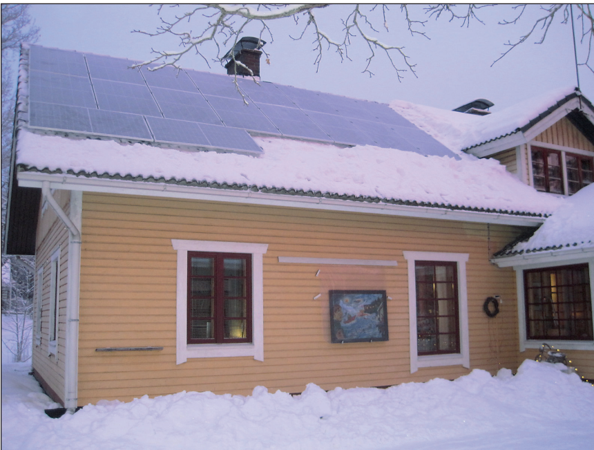
Illalla paneelit olivat katolla. Alettiin odottaa auringon nousua.