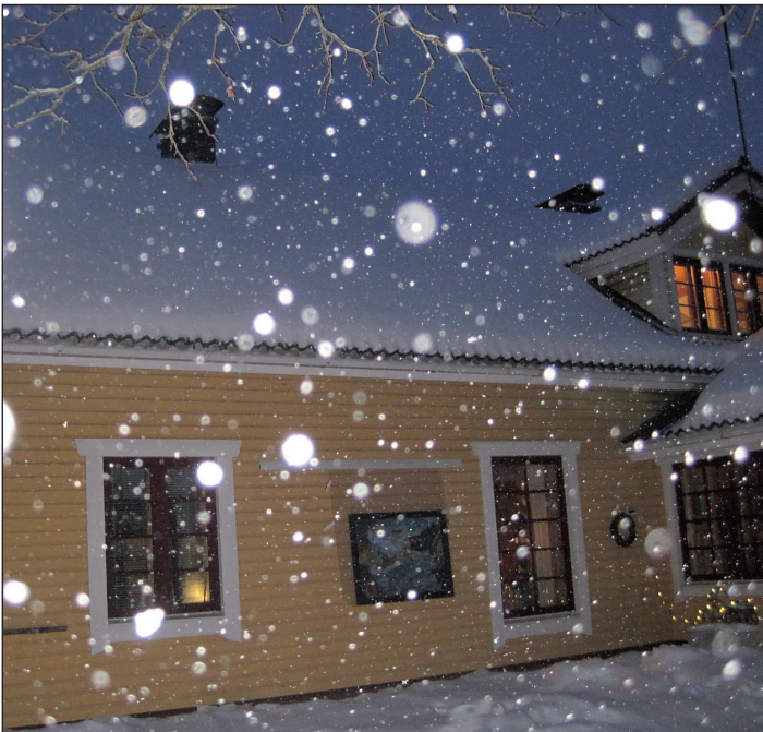
Aamulla pakkasta ja tuiskua.

Paneelit asennettiin yhdessä päivässä. Lumi ja pakkanen eivät estäneet, kun kovat kundit tulivat hommiin.