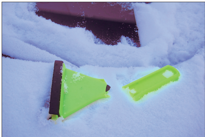
Kertakäyttöraappa. Ei sovi kierrätykseen.