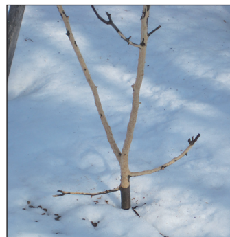
Nuoren omenapuun kohtalo viisastuttaa

Kokemus on verrattoman ihana ja saa toivomaan uusia oivalluksia. Kun suo niille mahdollisuuden, niitä tulee, ja pääsee viisastumisen kierteseen. Hauskaa ja mielenkiintoista riittää.