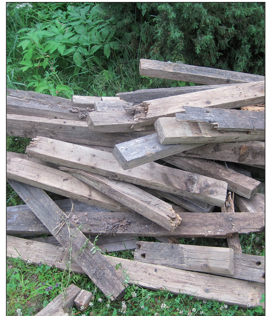
Energia talteen. Edesmennyt laiturii pätkitään saunapuiksi.