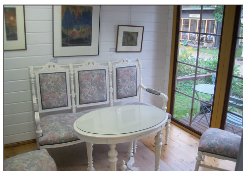
Aquassa istahtadat 140-vuotiaalle tuolille. Ikkunasta näkyy Tinto.