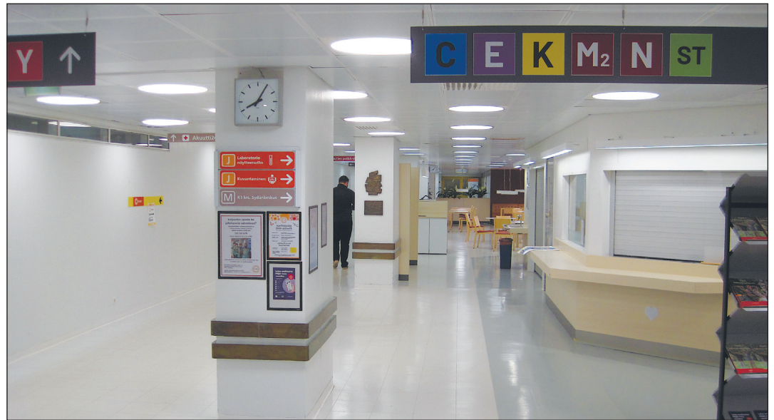
Ahtaat toimitilat heikentävät tehokkuutta. Kuvattu arkisena aamupäivänä

YLE, Helsingin Sanomat ja hännystelijät itkivät ja raivosivat. Media valitti joutuneensa perussuomalaisten armottoman hyökkäyksen uhriksi. Media vakuutti, että linja pitää: Paskat me totuudesta. Me ei uutisoida politiikasta. Me tehdään politiikkaa. Median luotettavuuden ja roolin setviminen näyttää ennakoivan ison pyykin pesua?