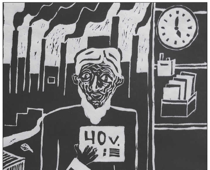
Propagandan mukainen elintaso oli jyrkässä ristiriidassa havaintojen kanssa. Elämä ennen puolueen valtaannousua kuvailtiin hirveäksi. Nykytilanteeseen piti olla tyytyväinen. Aleksis Joensuun puupiirroksen vedos