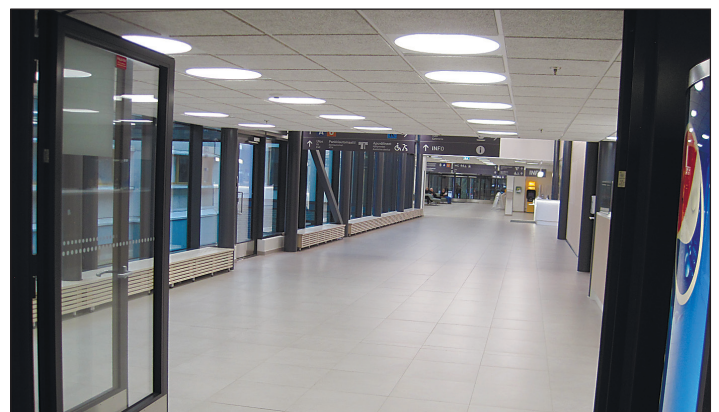
Potilasruuhkien ongelmia (törmäyksiä ym.) lievennetään hyvällä valaistuksella.

tarpeet tyydyttämättä jättäminen ehkäistiin poistamalla kouluterveydenhoitajien virat. Myös sosiaalitoimessa palvelut paranivat, kun ei kytätty ihmisiä. Asiakkaat saivat mitä pyysivät ja olivat onnellisia.