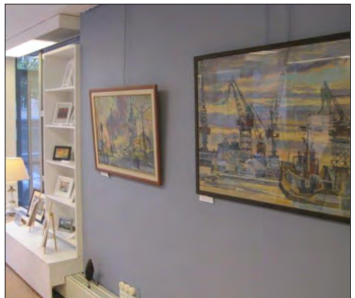
Art Arrakoskella Padasjoella on kesäisin monipuolinen taidenäyttely, josta olemme ostaneet teoksia.