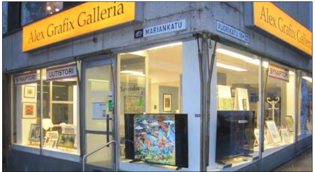
Galleria sijaitsee 400 metriä torilta, Mariankadun ja Vuorikadun kulmassa.

Lahti on talviurheilukaupunki. Kuuluksa on myös