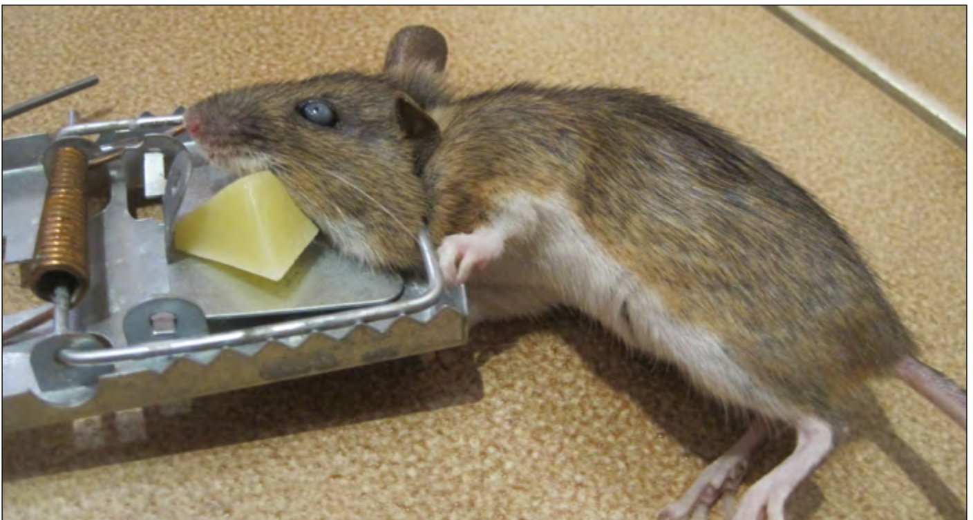
Alkoholi ihmiselle on kuin juusto hiirulaiselle. Ensin jäädytään koukkuun, sitten mennään loukkuun.

Nykyinen muoti, myönteinen asennoituminen huumeisiin hirvittää. Puheet huumerikollisuuden jättämisestä tuomitsematta viestittävät, että huumeissa ei ole mitään pahaa. Monet vaikeasti huumeriippuvaiset ovat päässeet toipumisen alkuun vankilassa, jossa onnistutaan täydellisesti estämään huumeiden saanti.