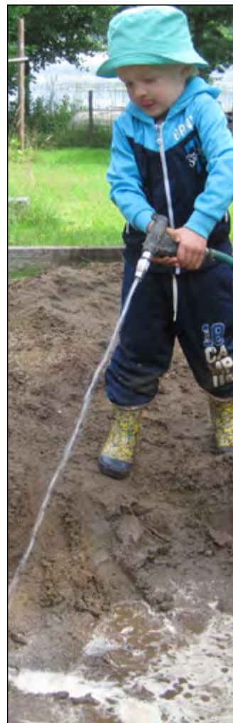
Lapset rakastavat työntekeä.

sen tarinan osoittaaksemme, että taustoiltaan erilaiset ja persoonallisuudeltaan hyvin erilaiset ihmiset voivat toimia ja pysyä yhdessä.