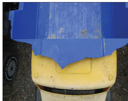
Näissä kuormureissa tosiaan särmää riittää.