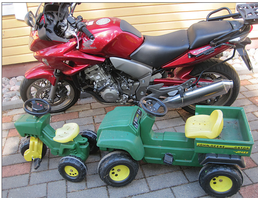
Nuoren polven hyötyajoneuvot on pysäköity pappin huvivehkeen viereen. Nämä traktorit ovat kestäneet kovempaa käyttöä kuin Honda.