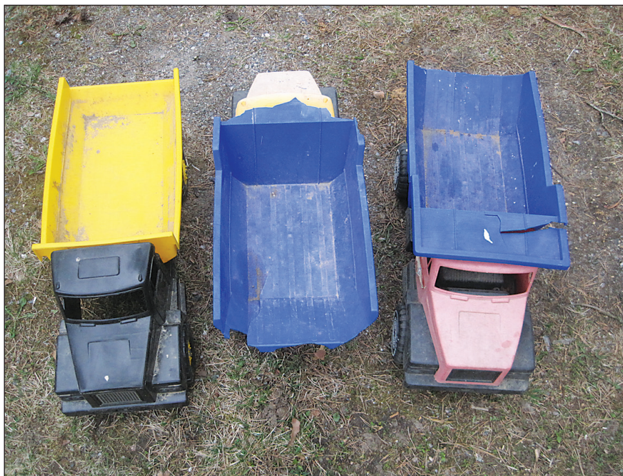
Kaksi autoa ovat samaa vuosimallia. Ne hajoavat samaan aikaan.

Vaarallista on lasten lelujen hajoaminen. Kun huomasin muovisten kuorma-autojen rikkoontumisen, meinasin ryhtyä lapsia kuulustelemaan: Kuka on hakannut kivellä kuorma-auton rikki? Onneksi tajusin itsestään hajoamisen ja vältyin moittimasta aiheettomasti.