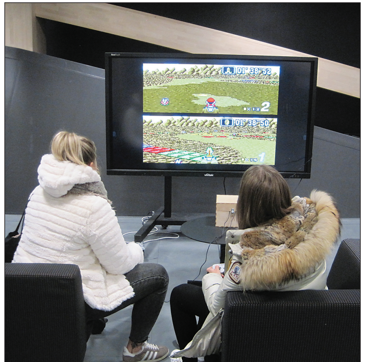
Upea kulttuurilaitos, uusi kirjasto Helsingissä on oodi siviilykselle. Kuva syksyllä 2019. Siellä on myös kirjoja.

Suomi tukee tätä uusvanhaa kulttuuria, josta lausumat ovat peräisin. Mutta Suomessa menestyy myös leppoisin kulttuurin nomenklatura, jota Taiteen edistämiskeskus tukee, esimerkiksi Veijo Baltzar.