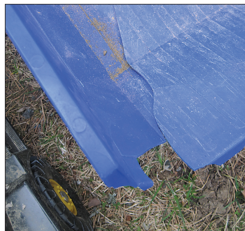
Näitä on mahdotonta korjata, liimata tms. Ei onnistu.