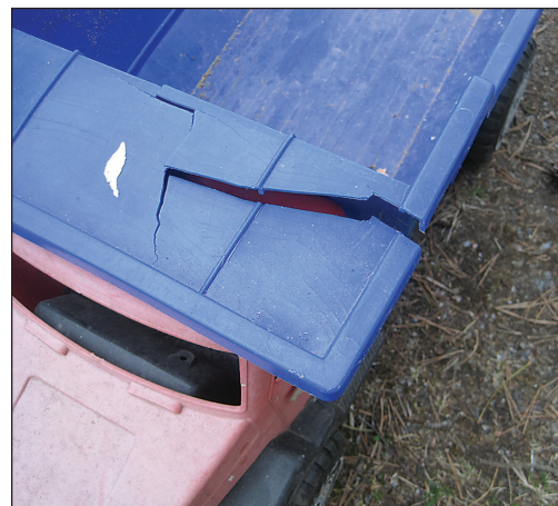
Muovin reunat viiltävät ja repivät.