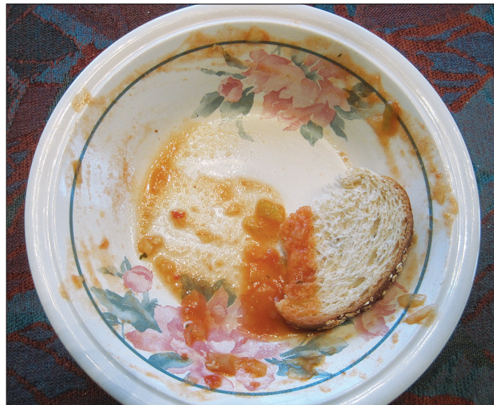
Iso-äiti näytti tällaista mallia.