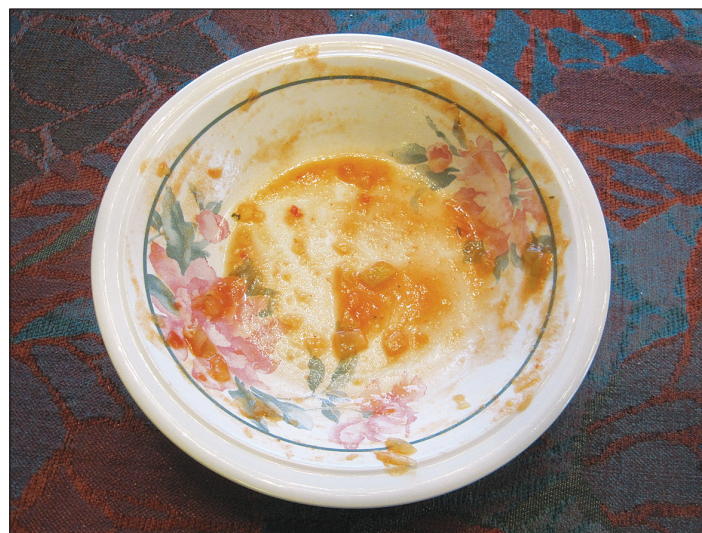
Kamalaa! Lautaselle jäi hyvää kastiketta, joka meinaa mennä hukkaan.

Ihmisen kaikkinaisen toiminta vaatii energiaa. Konkreettiset aikaansaannokset syntyvät raaka-aineista. Jos tosissaan ollaan kiinnostuneita ilmastosta, on muistettava, että koko ravintoketju pelloilta ruokapöytään tuottaa päästöjä. Eksoottisen hedelmän kuljettaminen valtameren takaa suomalaisen roskikseen asti on ympäristölle vihamielinen teko.