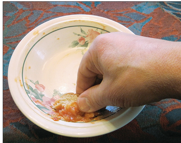
Säästyy ruokaa. Säästyy esihuuhtelun vaiva ennen tiskikoneeseen laittamista.